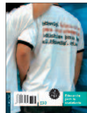
6 unidades / 96 páginas