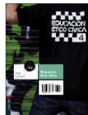
6 unidades / 96 páginas